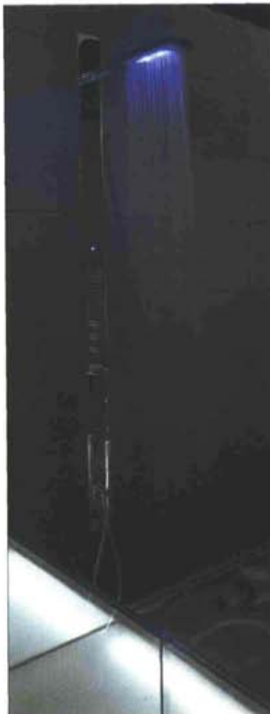
6-7. Acquazzura, soffione doccia con LED azzurri o bianchi, Fantini Rubinetti.

All can be found in Grandform baths. Digital switchboards control the hydrotherapy systems, from time to time activating micro-spray injectors of air with ozone, oxygen-enriched direction-adjustable jets, 21-colour multi-LED spots, aromatherapy nebulizer and, last but not least, in the brand new Emoticon, an audio speaker system linked to an MP3 player on the side of the tub.