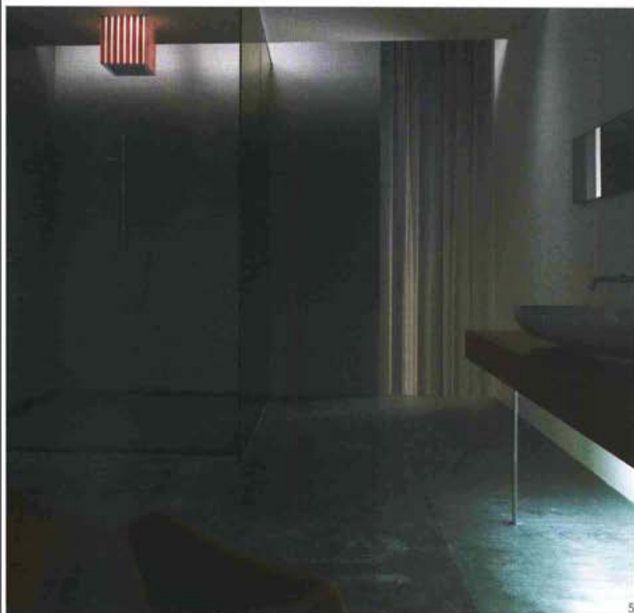
5. Lumière Shower Quadro, Bossini.

È possibile trovare tutto questo nelle vasche firmate Grandform. Centraline digitali controllano i sistemi idroterapici, attivando di volta in volta gli iniettori a microdiffusione di aria con ozono, i jet orientabili ad acqua arricchita di ossigeno, gli spot multiled con 21 colori, il nebulizzatore per l'aromaterapia e, infine, nella nuovissima Emoticon, l'impianto audio di diffusione sonora collegato al lettore MP3 posto a bordo vasca.