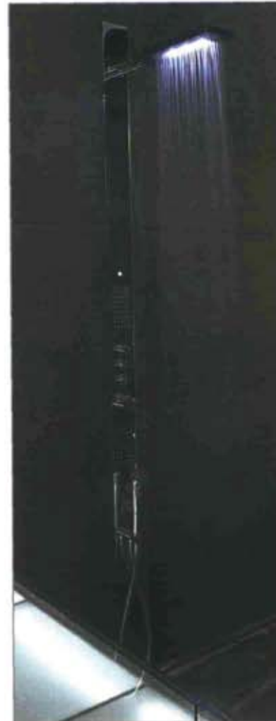
6-7. Acquazzura, shower head with blue or white LED, Fantini Rubinetti.